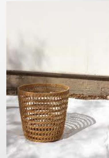
Working Together, Providing Certainty, Securing Success